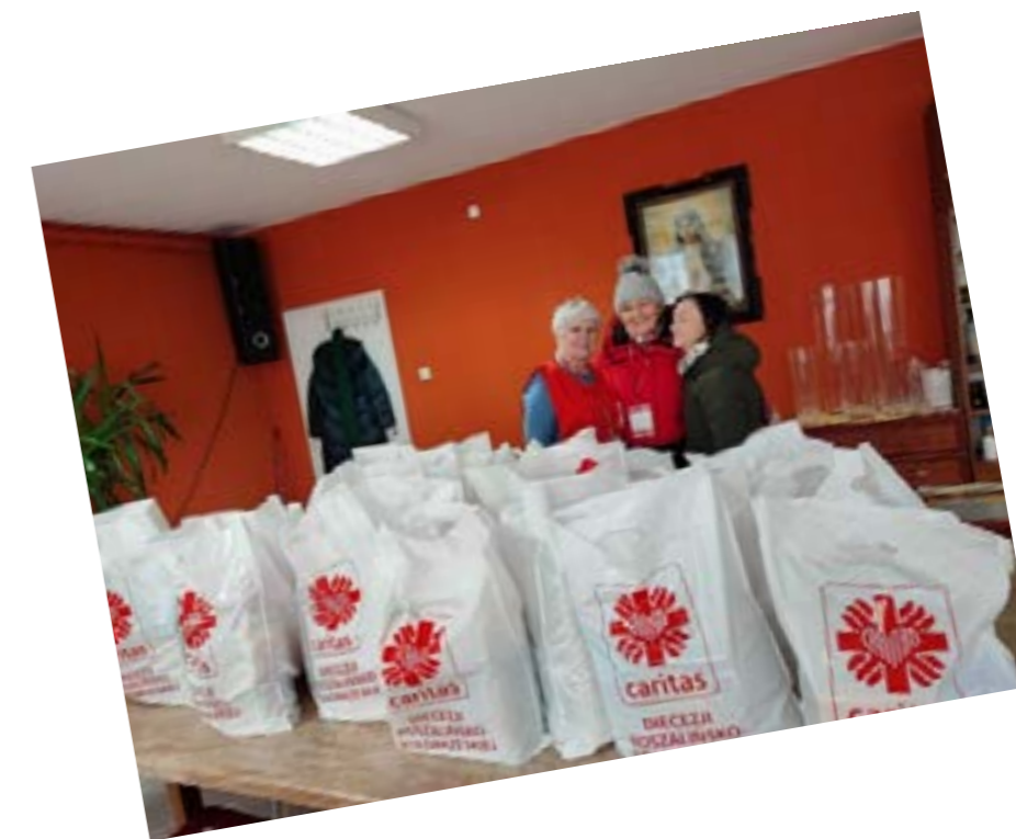
Przytulamy- Zespół Parafialny Caritas Gościno