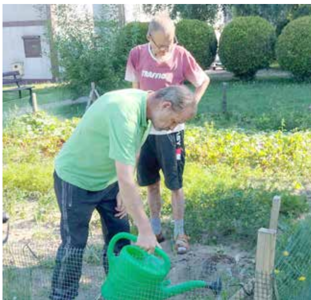
Prace ogrodowe sadzimy miętę

odwiedzających liczne atrakcje – gry terenowe, spacer, konkursy, warsztaty, spotkania z przyrodnikami i pszczelarzami. W tym dniu staraliśmy się przekazać naszym Uczestnikom nieco więcej wiedzy o pszczołach i odkrywać ich tajemnice, a także wyrażać wdzięczność za bogactwo plonów, które im zawdzięczamy.