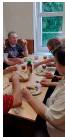
Zdrowe i kolorowe śniadanie w Promyku