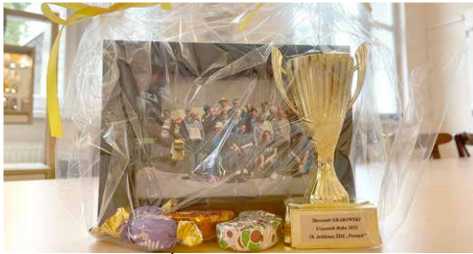
Upominek dla Uczestników ŚDS Promyk