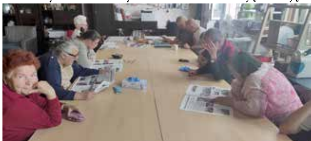
Uczestnicy podczas biblioterapii

Ponadto Uczestnicy mają zapewnione codzienne śniadania i gorące obiady przygotowywane w ramach treningu kulinarnego oraz piątkowy słodki poczęstunek podczas społeczności.