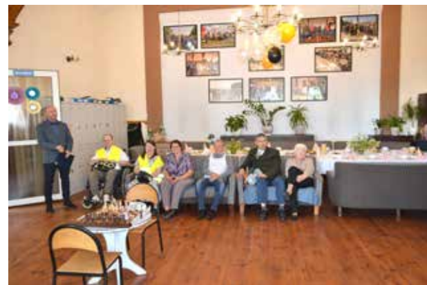
Uczestnicy podczas występu artystycznego