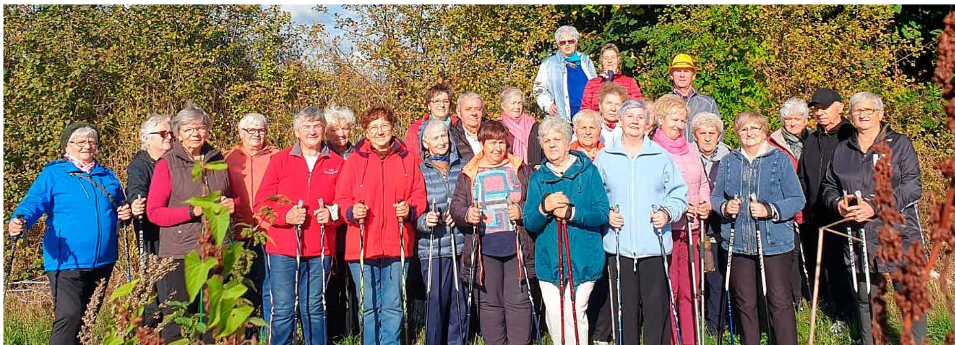
Spacer z kijkami Nordic Walking