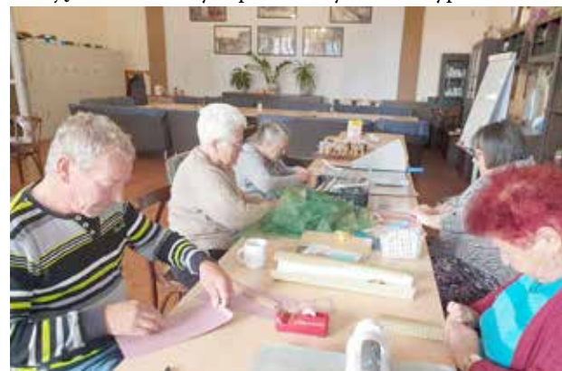
Uczestnicy w trakcie zajęć plastycznych