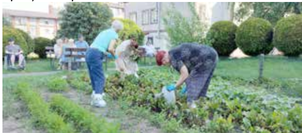
Hortikuloterapia czyli terapia za pomocą ogrodów

Uczestnicząc w pracach ogrodowych i pozostając w kontakcie z przyrodą podopieczni ŚDS realizują też roczny plan terapeutyczny i ćwiczą codzienne umiejętności praktyczne, co pozytywnie wpływa na pielęgnowanie umiejętności zaradności życiowej i zwiększa samodzielność w tym zakresie. Podopieczni systematycznie podlewają i plewią ogród, ale też zbierają plony, które służą do treningów kulinarnych, zdrowych śniadań i kolorowych sałatek. W sierpniu Uczestnicy posadzili również miętę, która posłuży nam, jako napar do zdrowych jesiennych herbatek.