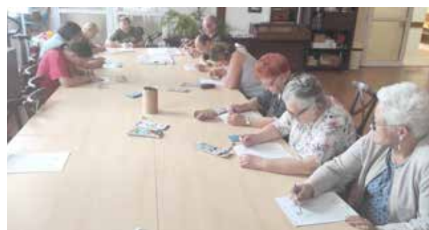
Trening funkcji poznawczych utrwalamy wiadomości

jekcji Uczestnicy utrwalili poznane już wartości odżywcze i prozdrowotne miodu, zapoznali się z budową i charakterystyką pszczół. Wspominaliśmy też wspólny majowy wyjazd do gospodarstwa pszczelarskiego „Miodowy Raj” w Dygowie. Z kolei we wtorek 9 sierpnia odbyły się warsztaty plastyczne, zajęcia praktyczne, treningi funkcji poznawczych i degustacja miodowych smaków. Uczestnicy posmakowali różnych gatunków miodów oraz pili zdrowy napój cytrynowo-miodowy przygotowany w pracowni kulinarnej. Tego dnia Uczestnicy pracowali też na kartach pracy. Było bardzooooo słodko.