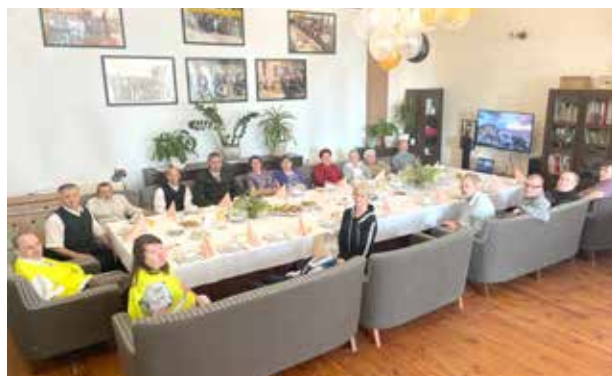
Uczestnicy podczas 18. Jubileuszu