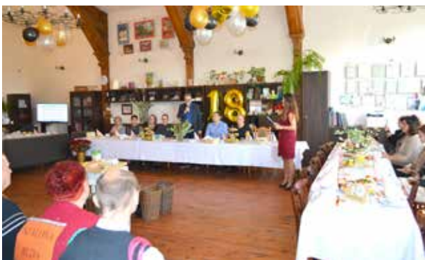
Goście podczas 18. Jubileuszu ŚDS Promyk