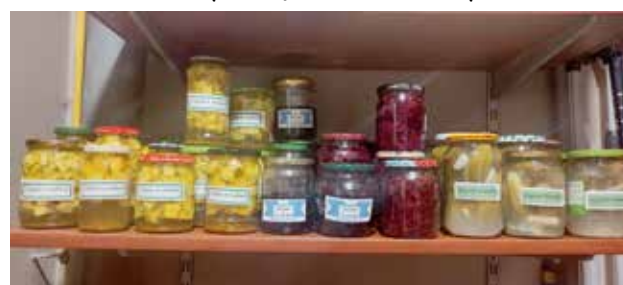
Przetwory z promykowej spiżarni