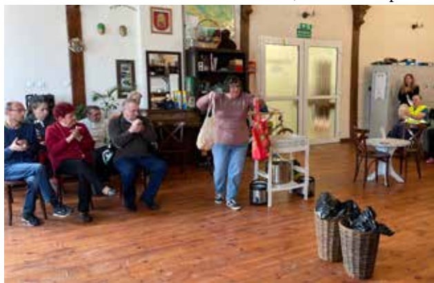
Teatroterapia-próby do występu artystycznego.

zajęć w pracowni plastycznej Uczestnicy przygotowawali stroje i rekwizyty, które posłużyły nam do występu artystycznego. Na zajęciach kulinarnych powstawały słodkie wypieki.