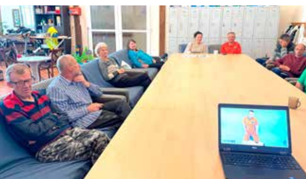
Zajęcia edukacyjna-Pierwsza Pomoc

Dnia Pierwszej Pomocy” odbyły się zajęcia edukacyjne z zakresu udzielenia pierwszej pomocy. Uczestnicy mieli możliwość odświeżyć sobie nabytą już wiedzę dotyczącą podstawowych zasad udzielania pierwszej pomocy przedmedycznej osobie poszkodowanej. Przedstawiliśmy projekcje oraz instruktaż dotyczący zasad postępowania w wypadku zatrzymania krążenia, utraty przytomności czy zadławienia osoby dorosłej. Uczestnicy dzielili się swoimi spostrzeżeniami oraz dotychczasowymi doświadczeniami w zakresie udzielania pierwszej pomocy przedmedycznej.