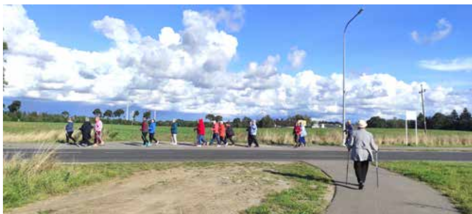
Spacer Nordic Walking