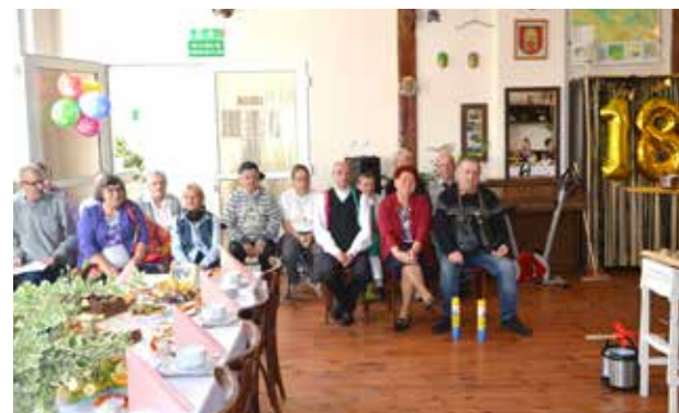
Uczestnicy podczas części artystycznej