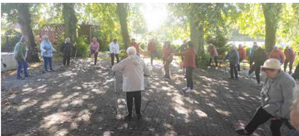
Ćwiczenia Nordic Walking