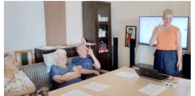
Trening umiejętności komunikacyjnych

Uczestnicy treningu poznają zagadnienia związane z komunikacją interpersonalną. Zdobyczą wiedzę na temat tego, jak w sposób otwarty i kulturalny prowadzić konwersację, jak nawiązywać i podtrzymywać rozmowę oraz poznają alternatywne sposoby porozumiewania się. W tym roku zgodnie z planem terapeutycznym na rok 2022, w ramach tr. umiejętności komunikacyjnych Uczestnicy podczas zajęć z wykorzystaniem alternatywnych sposobów porozumiewania się utrwalają poznane już metody alternatywnej komunikacji piktogramy jako alternatywne narzędzie porozumiewania się. W ramach treningu odbywają się zajęcia indywidualne i grupowe. Podczas zajęć uczestnicy pracują z wykorzystaniem materiałów edukacyjnych PWN, które znacznie wzbogacają terapię, wśród nich są: karty pracy, ćwiczenia, tablice magnetyczne, piktogramy, poradniki, gry oraz instrukcje, uwzględniające specjalne potrzeby edukacyjne naszych podopiecznych. Na zajęciach prezentowane są również projekcje a Uczestnicy wykonują ćwiczenia