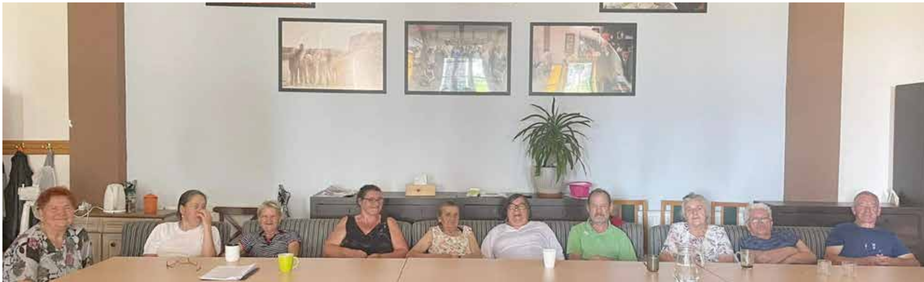
Nowy wystrój sali w ŚDS Promyk

Ponadto wystrój Sali głównej ŚDS „Promyk” został wzbogacony o unikatowe fotografie umieszczone w drewnianych ramach, ukazujące Uczestników podczas codziennych zajęć w ośrodku. Foto-galeria robi nie małe wrażenie i bez wątpienia dodaje naszej Sali uroku i oryginalności. Sposobów na dekorację ścian jest wiele, ale postanowiliśmy, że najciekawszą formą będzie galeria ze zdjęciami. Wyeksponowano fotografie, które budzą w nas największy sentyment, ale też te, które ukazują codzienną pracę i zaangażowanie Uczestników podczas różnorodnej terapii.