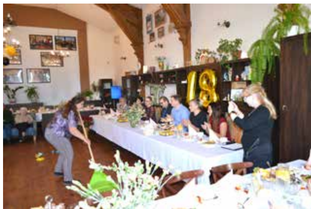
Jubileuszowy występ artystyczny