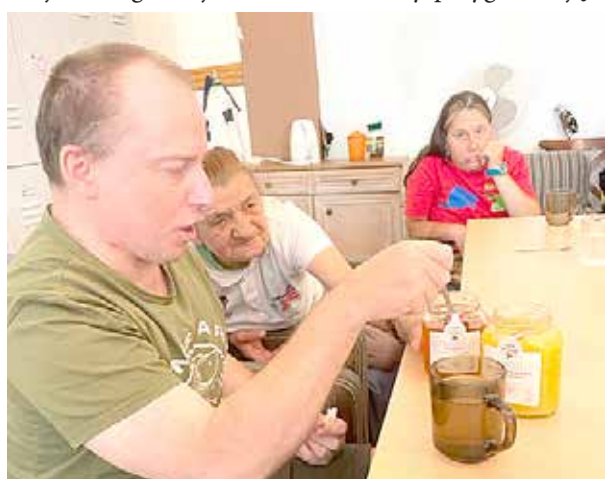
Degustacja miodowych smaków

8 i 9 sierpnia w „Promyku” celebrowaliśmy „Wielki dzień pszczół”. To święto powołane do życia dzięki programowi „KUJAWSKI- Pomagamy pszczołom”. Obchodzone jest co roku 8 sierpnia. Z tej okazji, w całej Polsce organizowane są wydarzenia poświęcone pszczołom. Placówki przyrodnicze w całej Polsce – ogrody botaniczne, parki narodowe i krajobrazowe, ośrodki edukacji ekologicznej, muzea i skanseny przygotowują dla