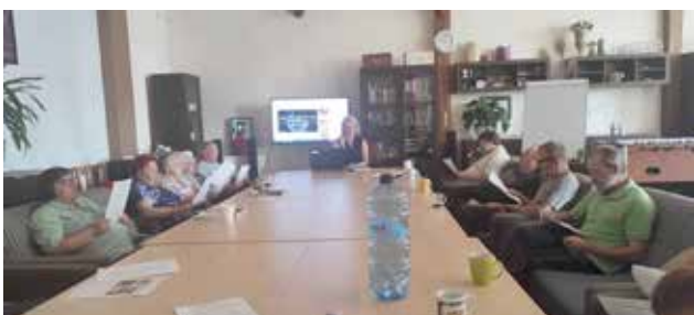
Uczestnicy podczas zajęć z muzykoterapii