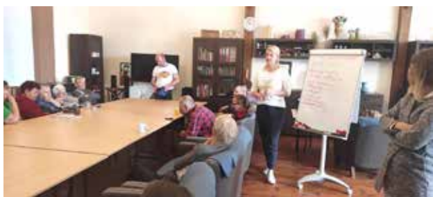
Światowy Dzień Pierwszej Pomocy

11 września 2022 r. w Środowiskowym Domu Samopomocy „Promyk” w ramach realizacji Planu Pracy Terapeutycznej na rok 2022 oraz z okazji „Światowego