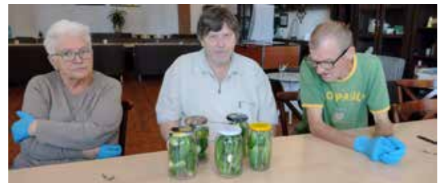
Uczestnicy podczas tr. kulinarnego robimy weki