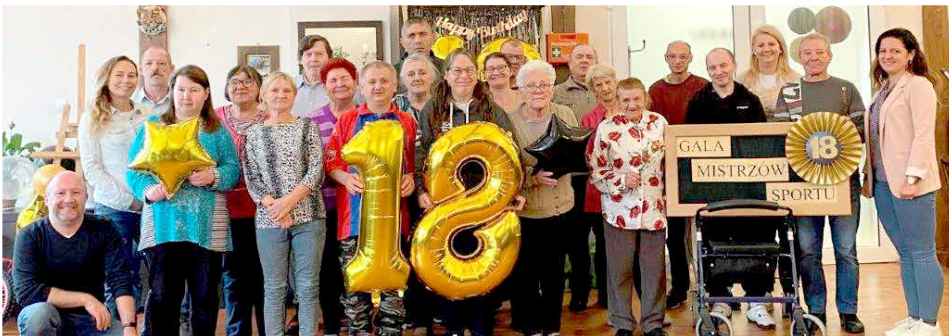
Kadra i Uczestnicy ŚDS podczas Jubileuszu