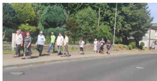
Terapia ruchowa spacer