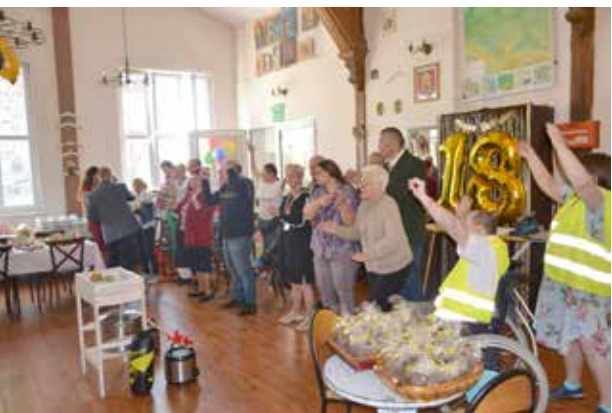
Uroczyste wręczenie upominków dla Uczestników