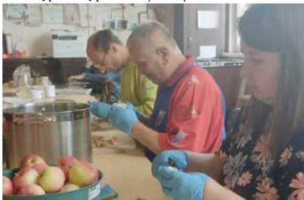
Trening kulinarny-mus jabłkowy