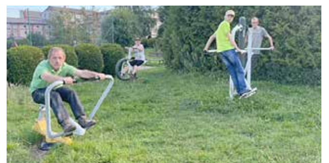
Uczestnicy podczas terapii ruchowej na Fit-Parku