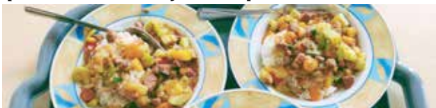
Leczo z cukinii w wykonaniu Uczestników