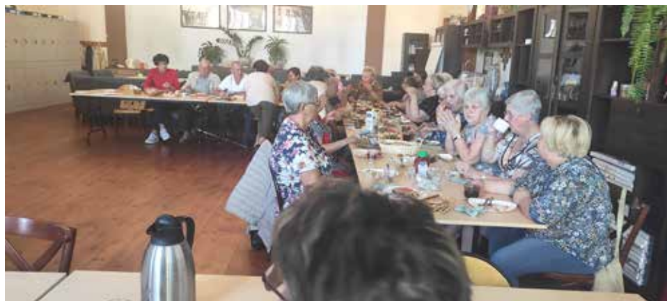
Wspólne biesiadowanie - rozpoczynamy sezon 2022-2023