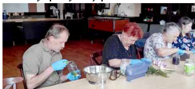
przygotowujemy weki na zimę