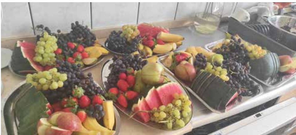
Słodki owocowy poczęstunek- urozmaicenie zajęć Klubowiczów