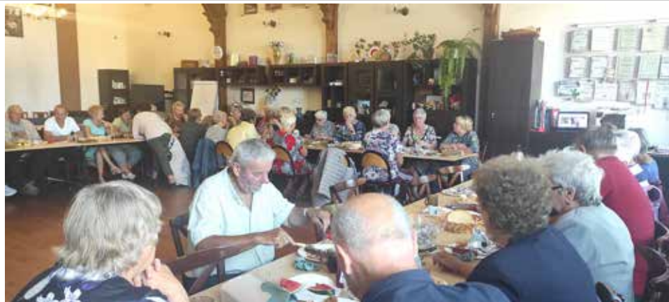
Wspólne biesiadowanie-rozpoczynamy sezon 2022-2023