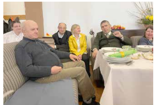
Uroczyste Śniadanie Wielkanocne

Aby każdy z nas był najedzony Na treningu kulinarnym Gdzie Uczestnik gospodarny Cudne dania się stworzyły Na białych obrusach będą lśniły. Dziękujemy gościom za przybycie na tę piękną uroczystość. To spotkanie na długo pozostanie w naszej pamięci. Było smacznie i bardzo uroczyste.