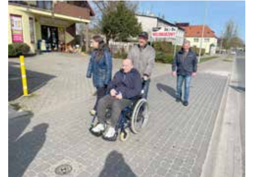
Uczestnicy podczas spaceru-terapii ruchowej