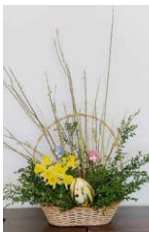
Wielkanocne stroiki przygotowane przez podopiecznych