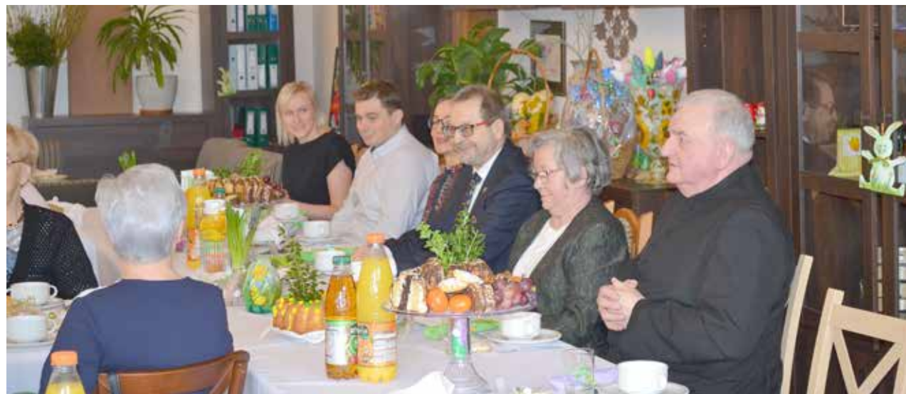
Zaproszeni goście podczas uroczystego Śniadania Wielkanocnego