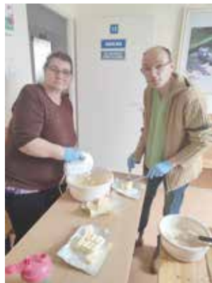
Trening kulinarny-wielkanocne wypieki