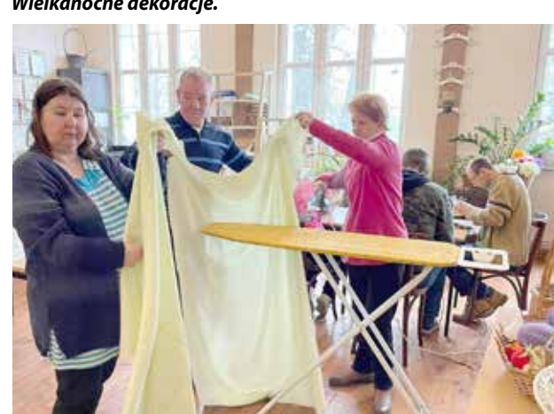
Trening umiejętności praktycznych czyli prasowanie obrusów