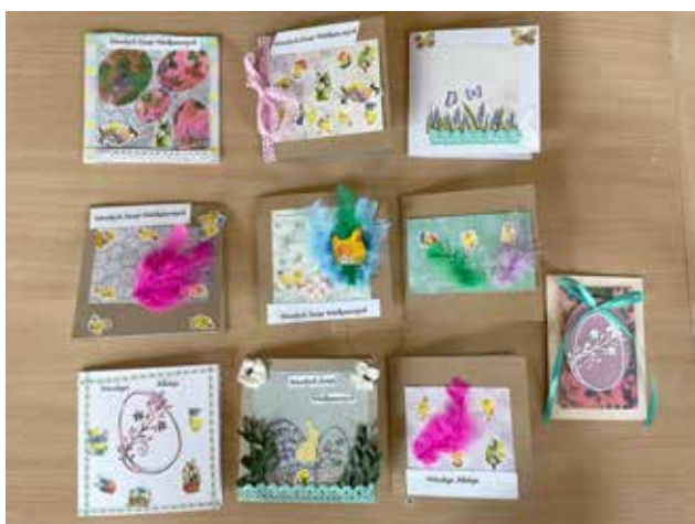
Kartki Świąteczne wykonane przez Uczestników