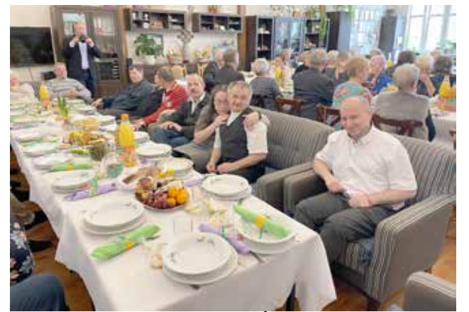
Uczestnicy podczas Wielkanocnego Śniadania