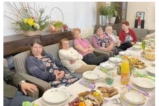
Uroczyste Śniadanie Wielkanocne