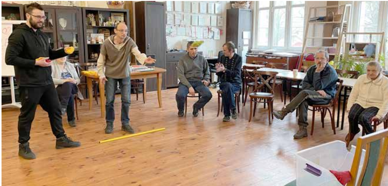
Terapia ruchowa prowadzona przez fizjoterapeutę.jpeg