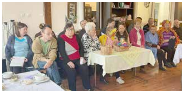
Uczestnicy podczas próby Wielkanocnej