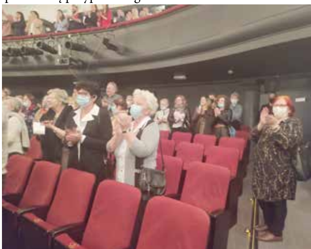
Klubowicze podczas spektaklu - Wieczorek pożegnalny - BTD Koszalin