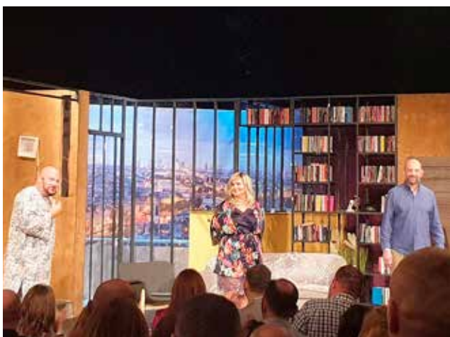
Wieczorek pożegnalny - artyści podczas owacji po spektaklu w BTD w Koszalinie