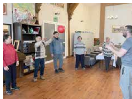
Zajęcia rehabilitacyjne z fizjoterapeutą