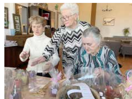
Zajęcia plastyczne - wykonywanie zapachowych świec przez Uczestników