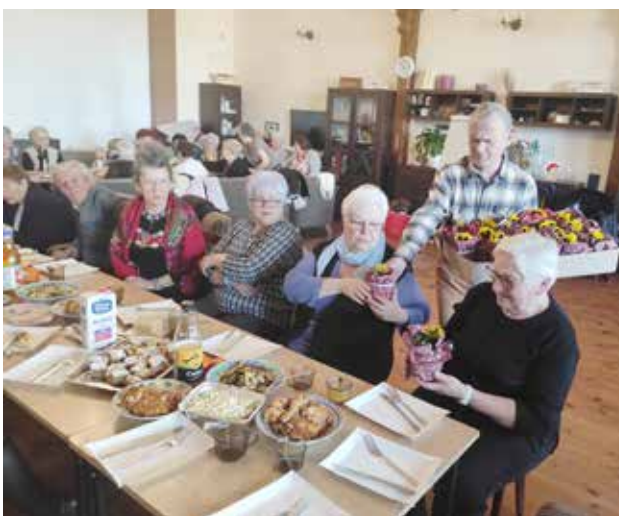
Dzień Kobiet oraz Dzień Mężczyzn w Klubie Seniora