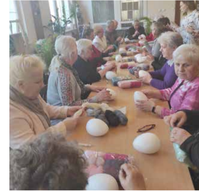
Seniorzy podczas zajęć filcowania na sucho