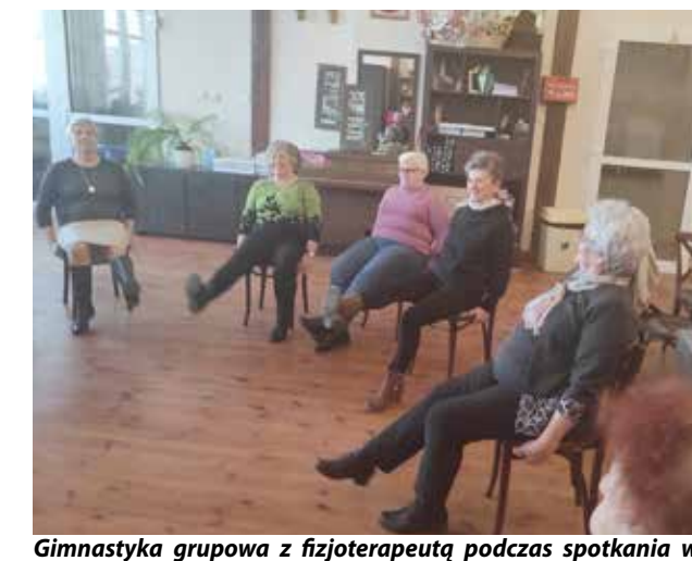
Gimnastyka grupowa z fizjoterapeutką podczas spotkania w Klubie Seniora