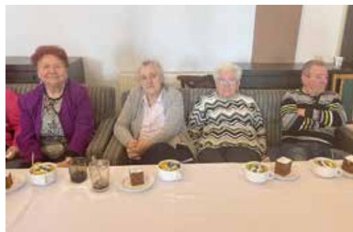
Uczestnicy celebrować Dzień Kobiet i Dzień Mężczyzn