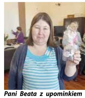
Pani Beata z upominkiem - żelowa świeca w szklanym naczyniu