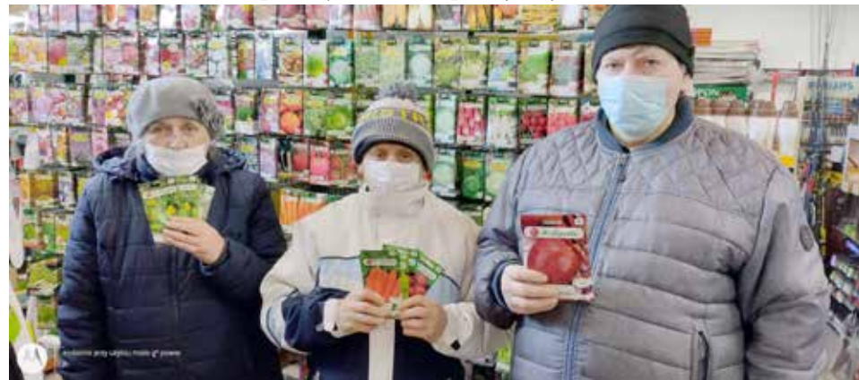
Trening umiejętności gospodarowania własnymi środkami finansowymi - zakup nasion

wo zasiali w doniczkach na rozsadę, która w okresie wiosennym trafi na grządki w ogródku. Posiano również owies i rzeżuchę, które posłużą nam jako dekoracja na wielkanocny stół. Zanim jednak Uczestnicy przeszli do zajęć praktycznych było trochę teorii i zadań na Kartach pracy w ramach tr. funkcji poznawczych. Rozwikłanie zadań i zagadek ogrodniczych, znacznie ułatwiło pracę podczas zajęć praktycznych.