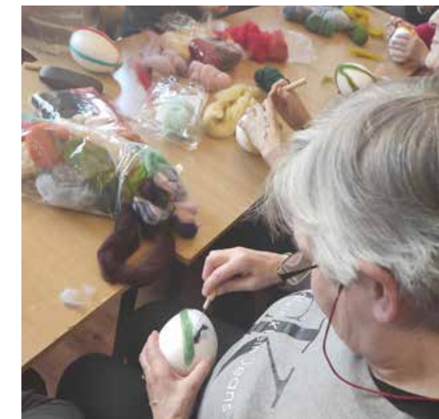
Filcowanie na sucho-zajęcia rękodzielnicze w Klubie Seniora