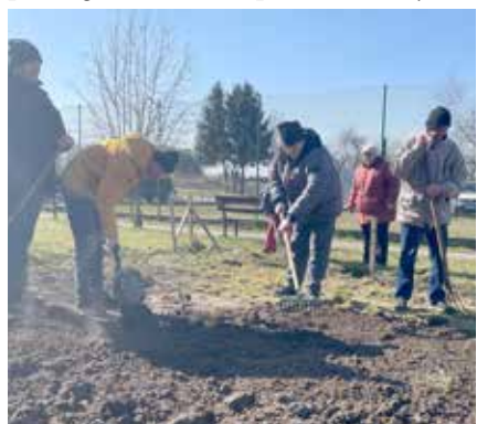
Trening ogrodniczy - przygotowanie ogrodu pod wysiew warzyw

miejsce, które pozwala nam odetchnąć podczas zajęć relaksacyjnych ale też jest świetną alternatywą dla terapii ruchowej.