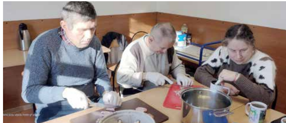
Uczestnicy w trakcie zajęć kulinarnych

Uczestnicy systematycznie kształtują umiejętności z zakresu treningu funkcjonowania w codziennym życiu, ale też