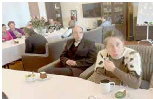
Obchody Dnia Kobiet i Dnia Mężczyzn

przygotowano aromatyczne świece żelowe i marchewkowe babeczki oraz wyjątkową kartkę z życzeniami. Panie nie kryły radości. Życzenia, upominek oraz słodkie babeczki z pewnością umiliły im dzień. Z okazji Święta Mężczyzn pracownicy GOPS obdarowały Panów słodkim poczęstunkiem.