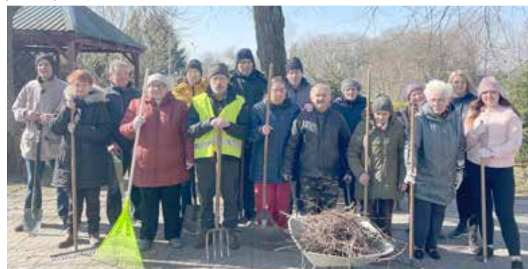
Pierwszy dzień wiosny – „W zdrowym ciele zdrowy duch”