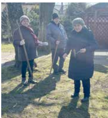
Wiosenne porządki terenów zielonych