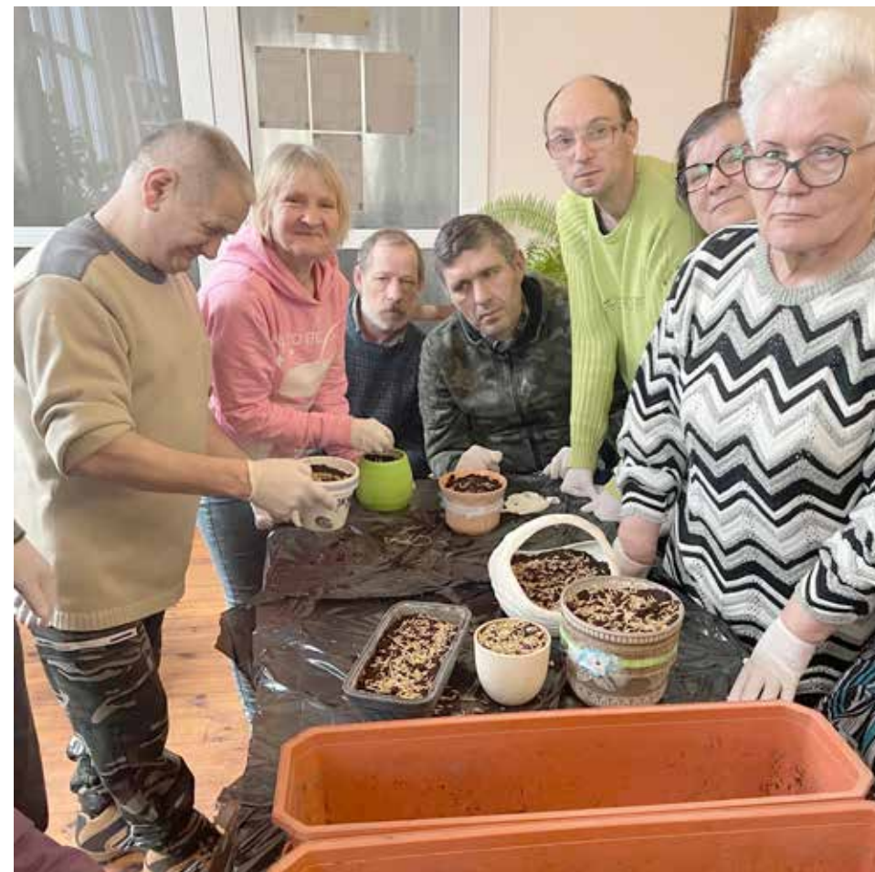
Trening ogrodniczy-przygotowanie rozsad