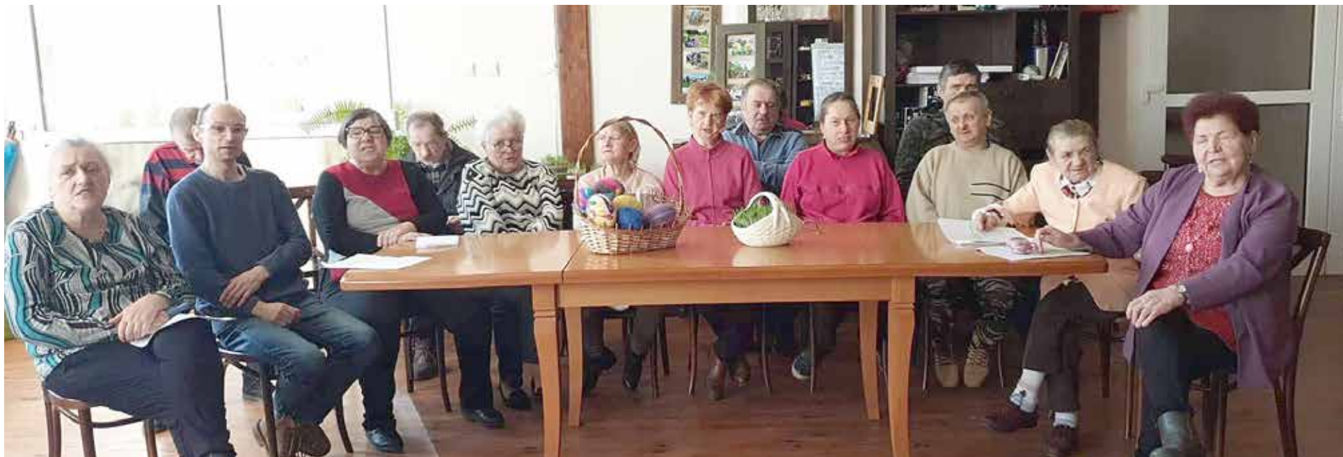
Uczestnicy na zajęciach z biblioterapii - utrwalają scenariusz wielkanocny

ki rocznego planu terapeutycznego pod hasłem „W zdrowym ciele zdrowy duch”, oddaje charakterystykę symboliki świąt wielkanocnych ale też przybliża spotkania i relacje rodzinne, odkreślając, jak ważne są dla nas. Zapowiada się niezwykle spotkanie wielkanocne choć przed nami bardzo pracowity czas.