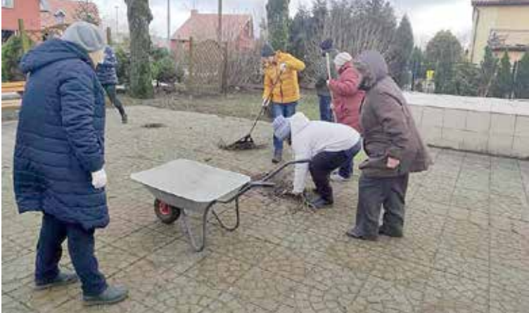
Trening ogrodniczy-porządki na Zielonej Skarpie