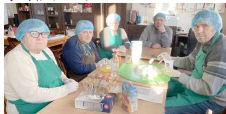
Trening kulinarny czyli faworki w wersji fit