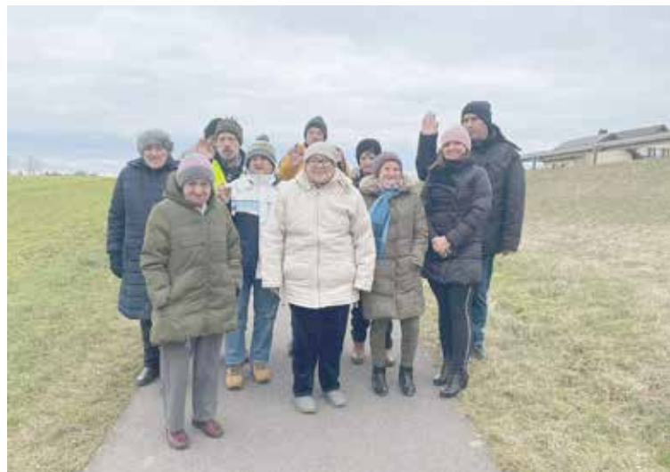
Spacer Uczestników czyli trening rekreacyjny