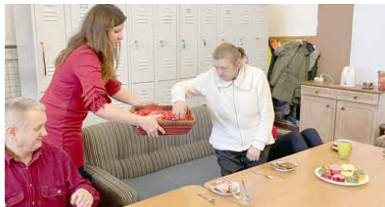
Walentynkowe upominki podarowane Uczestnikom

gotowała zdrowe przysmaki m.in. owocowe galaretki z bakaliami w kształcie serc oraz gofry z mąki pełnoziarnistej z dodatkiem płatków owsianych. Nowe smaki i „odchudzone” receptury przypadły Uczestnikom do gustu. Zdrowe ciało to również sprawny umysł, a śmiech to zdrowie dlatego też podczas Walentynek ćwiczyliśmy umysł za pomocą zagadek na wesoło, były krzyżówki, zadania, zagadki ale też czytaliśmy romantyczne wiersze miłosne.