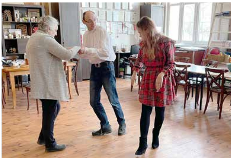
Nauka kroków tańca cha-cha