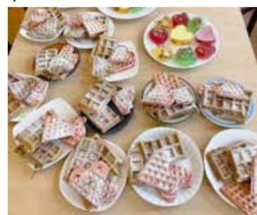
Zdrowe smakołyki w wersji fit