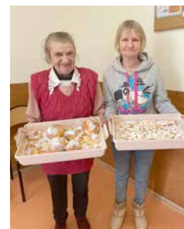
Odchudzamy Tłusty Czwartek-fit pączki i faworki