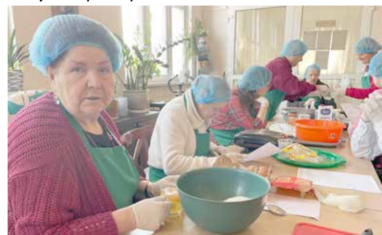
Trening kulinarny-przygotowanie fit przysmaków