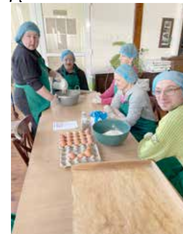
Uczestnicy przygotowują dietetyczne pączki