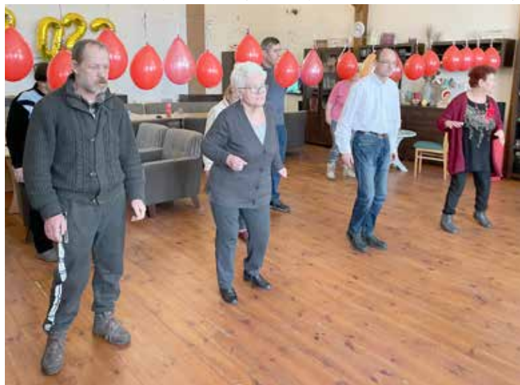
Uczestnicy podczas nauki tańca lambada