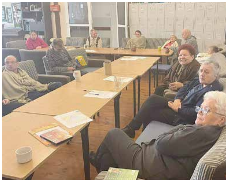
Trening funkcji poznawczych-ćwiczymy umysł za pomocą zagadek