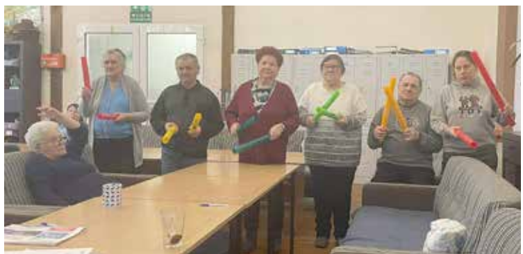
Muzykoterapia-nauka grania na bum bum rurkach

Systematycznie kontynuujemy zajęcia kulinarne . W ramach zajęć Uczestnicy co dzień rano przygotowują pyszne śniadania, a niekiedy również dania obiadowe i przekąski. Przygotowywanie potraw o różnym stopniu trudności z uwzględnieniem konieczności zachowania czystości i zasad higieny