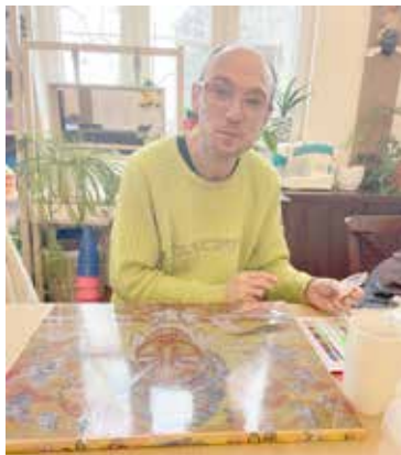
Pan Sylwester-zajęcia plastyczne

wyboru krajobrazy, portrety oraz sztukę przedstawiającą rośliny i zwierzęta. Oferowana mozaika