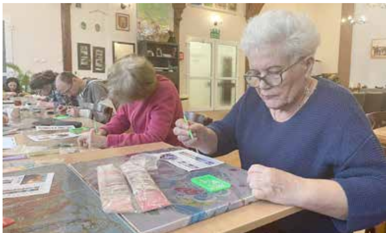
Uczestnicy podczas zajęć plastycznych poznają nową technikę-mozaika diamentowa

Podczas terapii w pracowni plastycznej Uczestnicy poznają nową metodę zajęć. W ŚDS „Promyk” powstają obrazy tworzone techniką mozaiki diamentowej. Jest to wspaniała forma spędzania wolnego czasu i nowe hobby, które pozwala Uczestnikom odprężyć się, zrelaksować i oderwać od codziennych spraw. Za pomocą aplikatora oraz kolorowych diamentów tworzone są prawdziwe dzieła sztuki. Ta nowa forma zajęć to nie tylko oryginalne hobby ale też wypoczęty umysł, dobry humor i czas spędzony z korzyścią dla siebie. Uczestnicy mają do