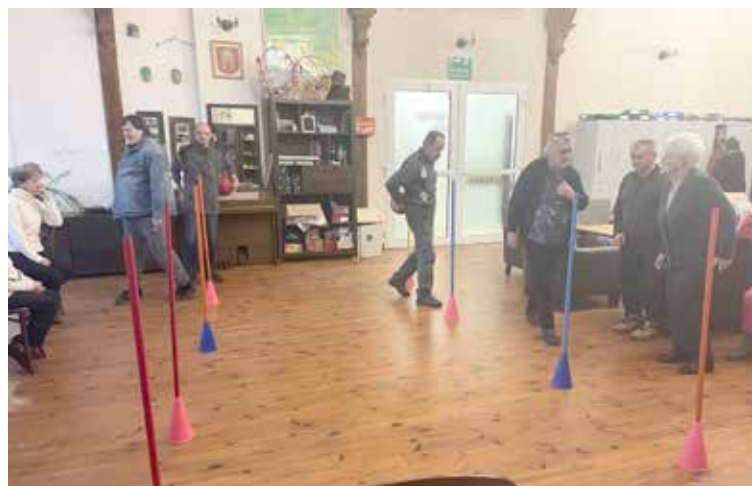
Poranna gimnastyka prowadzona przez terapeutów

(choreoterapia), spacer (trening rekreacyjny), poranna gimnastyka (ćwiczenia prowadzone przez terapeutów) oraz zajęcia rehabilitacyjne (fizjoterapia z wykwalifikowanym fizjoterapeutą). Korzystamy z coraz wyższych temperatur i gdy tylko mamy możliwość udajemy się na spacer ale też porządkujemy zieloną skarpe (trening ogrodniczy), aby móc przygotować się na wiosenne zajęcia.