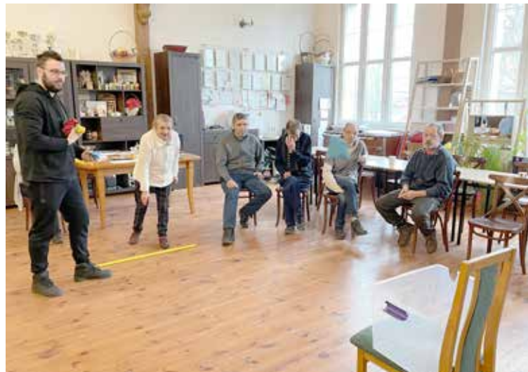
Zajęcia rehabilitacyjne z fizjoterapeutą