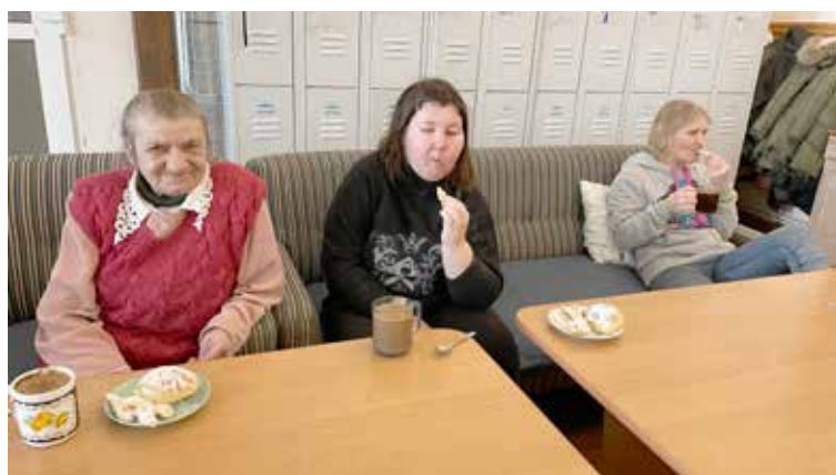
Degustacja pysznych smakołyków

re znamy z babcinych receptur, ale bez wątplenia zasmakowały Uczestnikom. Tego dnia w ŚDS było niezwykle aromatycznie, smacznie i uroczyście.