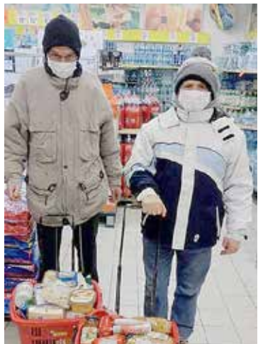
Trening gospodarowania własnymi środkami finansowymi-Uczestnicy na zakupach.

Zatem w „Promyku” pracujemy systematycznie i realizujemy miesięczne plany terapii, pamiętając o otaczającej nas pandemii. Byłe do wiosny!